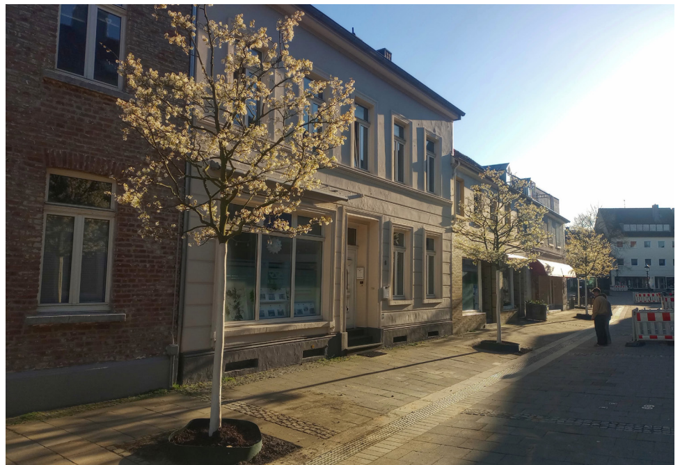
Seit Ende März stehen an der Tönisvorster Straße Richtung Lindenplatz die neuen Bäume. Das Foto ist am Abend des 1. April entstanden.

aussichtlich an der Tönisvorster Straße beginnen und im weiteren Verlauf im Bereich der südlichen Hochstraße und auf dem Lindenplatz fortgesetzt.