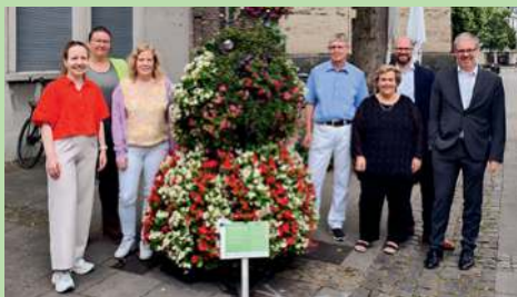
Tag der Einweihung

Auf der Fußgängerzone Hochstraße vor der Stadtbibliothek steht die neue, mit Blumen bestückte Figur „Froschkönig“. Sie wurde zur Aktion „Viersen blüht“ aufgestellt und trägt zur Verschönerung der Viersener Stadtteile bei.